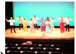
ミニ発表会の演技(太極拳)