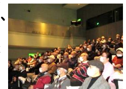
皆さんマスク着用と間隔を保って