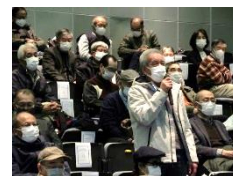
活発な質問も多く寄せられ