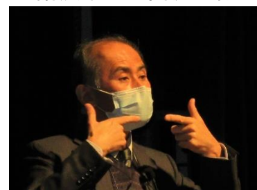
約2時間マスク着用で講演をいただく

なお、今回の講演は、コロナの感染防止から聴講者の制限などがありましたが、コロナ事態収束後は、多くの皆さんで講演をお聴きしたいのもです。それまで一人ひとりが、明るく、楽しく、元気よくいきたいと思います。お元気で！！